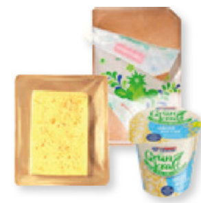
Verschließbare Trays & Cups