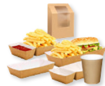
Take-Away- & OTC-Verpackung