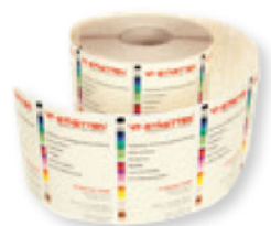
Aufkleber & Etiketten