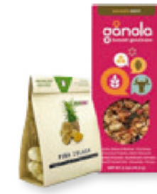
Verpackung für Trockennahrung