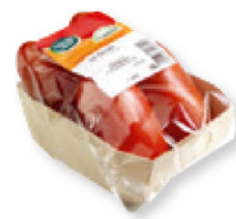
Obst und Gemüse Trays