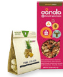
Verpackung für Trockennahrung